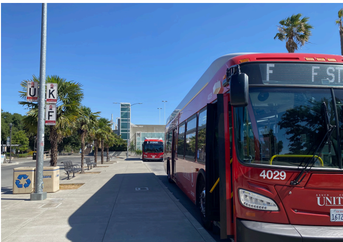
Autobuses de Unitrans en el Memorial Union Transit Center

Un plan de transporte a corto plazo (plan de transporte) es un plan de acción para mejorar los servicios de transporte durante los próximos cinco a diez años. El plan se enfoca en hacer que Unitrans y el transporte comunitario de Davis (DCT) tengan un mejor funcionamiento para usted. Para ello, se analizan las flotas de vehículos, los costos, la financiación, las rutas, los horarios, las paradas de autobús y otras instalaciones de transporte actuales de Unitrans y del DCT. Este plan es necesario para que las agencias de transporte reciban fondos federales y fondos de la Ley de Desarrollo del Transporte del Estado, que son fuentes de financiación importantes para el transporte local en Davis.