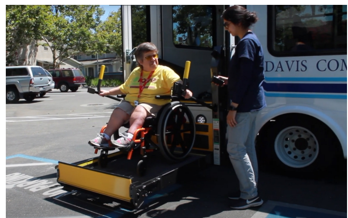
Pasajera usando plataforma elevadora para subir a un autobús del transporte comunitario de Davis